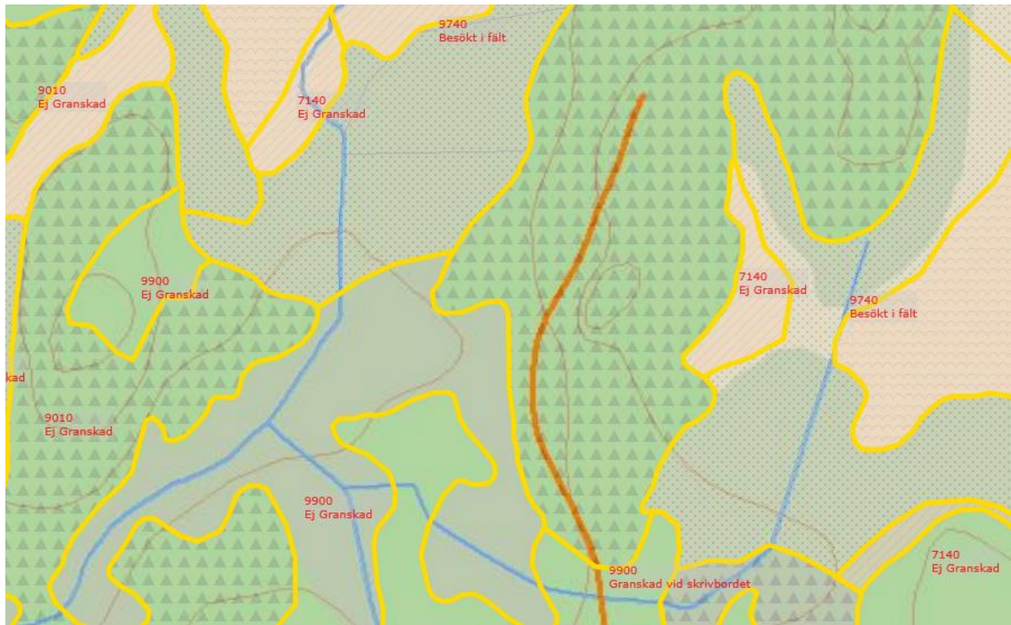
Figur 3. Genom att använda etiketter (labels) går det att bedöma ytornas karteringsstatus eller naturtypsstatus.