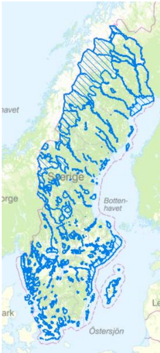
Figur: Kartan till vänster, blå områden, visar riksintresseanspråk för friluftsliv och kartan till höger visa riksintresseanspråk för naturvård, gröna områden