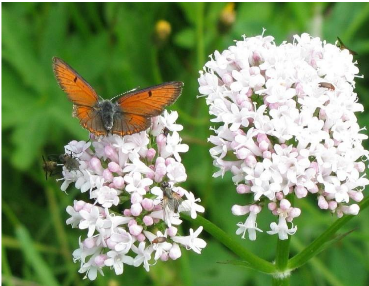
Violettkantad guldvinge på flädervänderot

Insektsfaunan är inte så väl undersökt men områdets karaktär och den rika förekomsten av död ved innebär att området troligen hyser en rik insektsfauna. Det rika inslaget av lövträd med hög ålder och god förekomst av död ved är förutsättningen för insektsfaunan. Flera skalbaggar knutna till död ved är påträffade vid en inventering 1993, däribland den rödlistade platt gångbagge ( Cerylon deplanatum ). Mnemosynefjäril är tidigare påträffad inom reservatet men är ej funnen under 2000-talet. Av sällsynta fjärilar kan också violettkantad guldvinge nämnas.