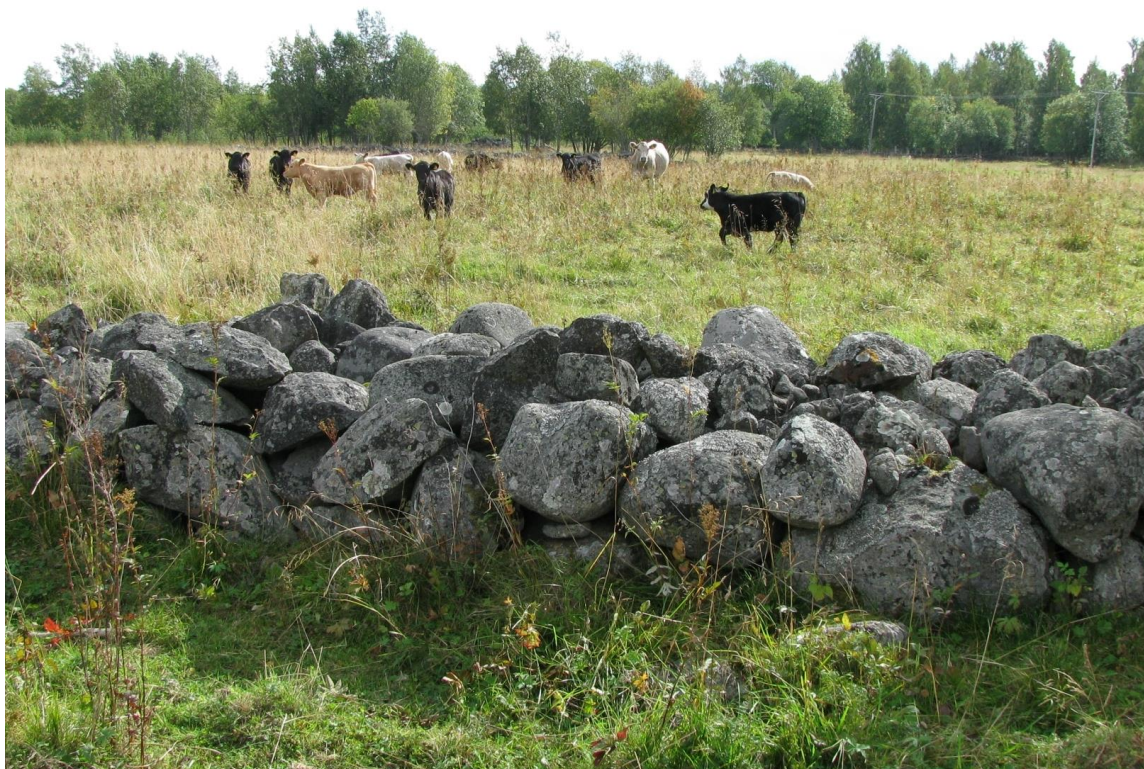
Odlingsrösen i form av stenmurar är vanligt i Fågelsången

Timrå kommun köpte marken på 1960-talet för att möjliggöra en industriexploatering med en ny massafabrik. Planerna blev inte av och marken arrenderades ut för betesdrift i ca 20 år. Efter en tid av ohävd återupptogs betesdriften i mitten av 1990-talet ungefär samtidigt som reservatsplanerna tog form. Sedan dessa är området indelat i flera olika betesfällor men en mindre del i söder, mot Gasabäcken, är undantagen från bete. Betesdriften består idag (2010) av hästar från ridskolan i den mittersta delen och nötkreatur i de övriga. Tidigare har även får bete förekommit. Avgränsningen uppåt mot växthuset och parkeringsplatsen är gjord utifrån den gamla översiktsplanen (ÖP90) där det fanns ett förslag på en ny väg söder om Söråkers samhälle ut mot Tynderö. Dessa vägplaner är ej längre aktuella.