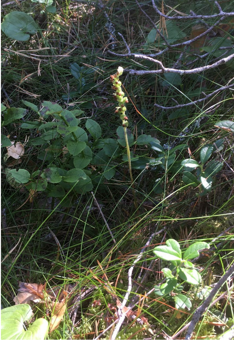
Knärot, en lågväxt orkidé i området . Foto: Länsstyrelsen, augusti 2021.