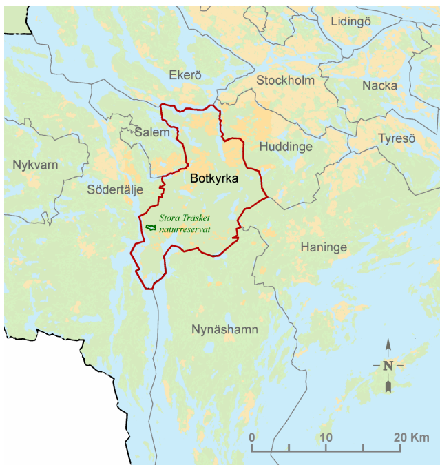
Naturreservatets läge i Stockholmsregionen