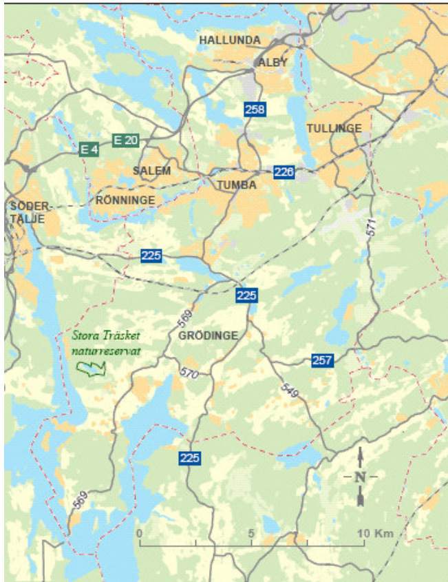
Naturreservatets läge i Botkyrka kommun