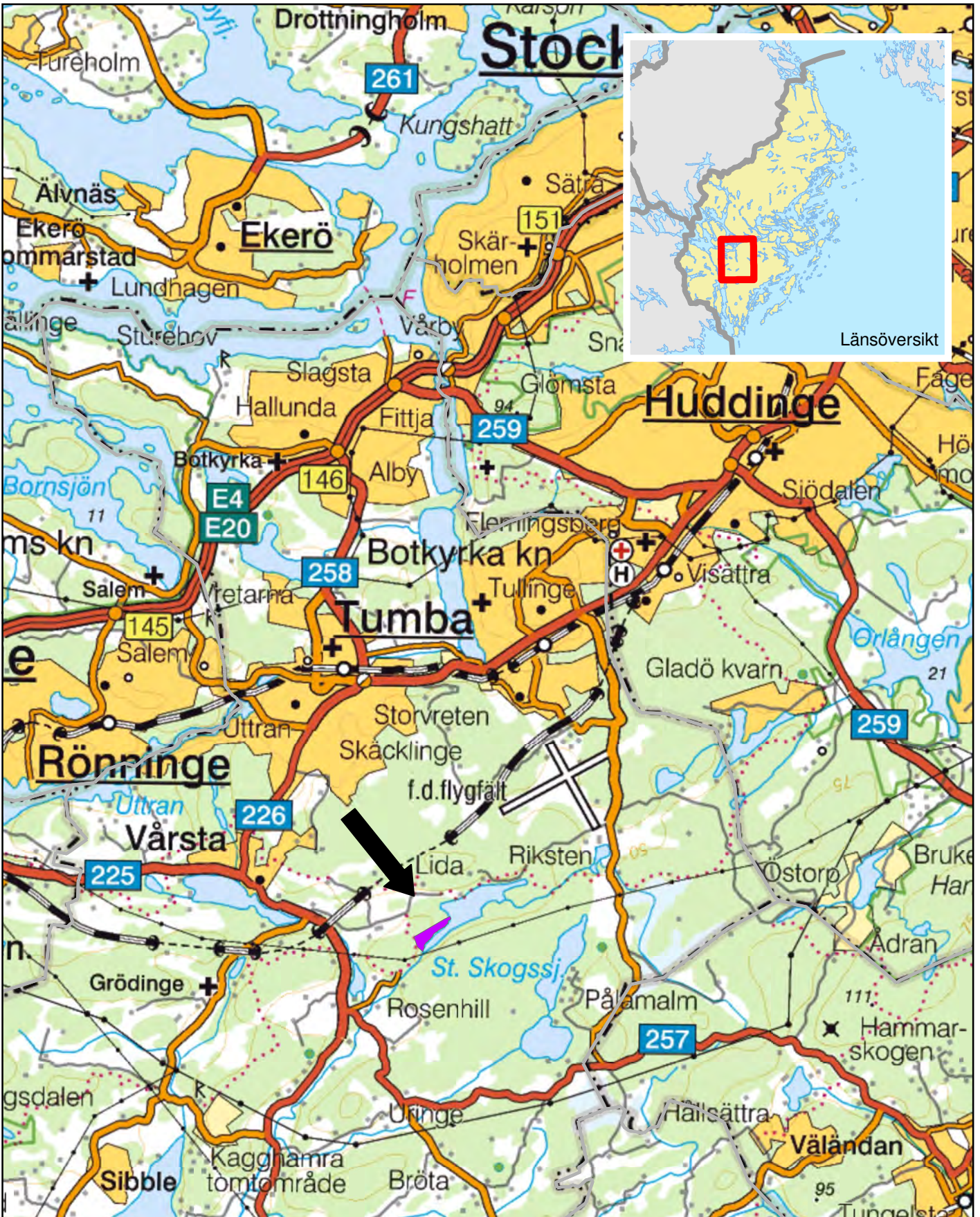
Bakgrundskarta © Lantmäteriet, 2012. Ur Geografiska Sverigedata, 106-2004/188-AB