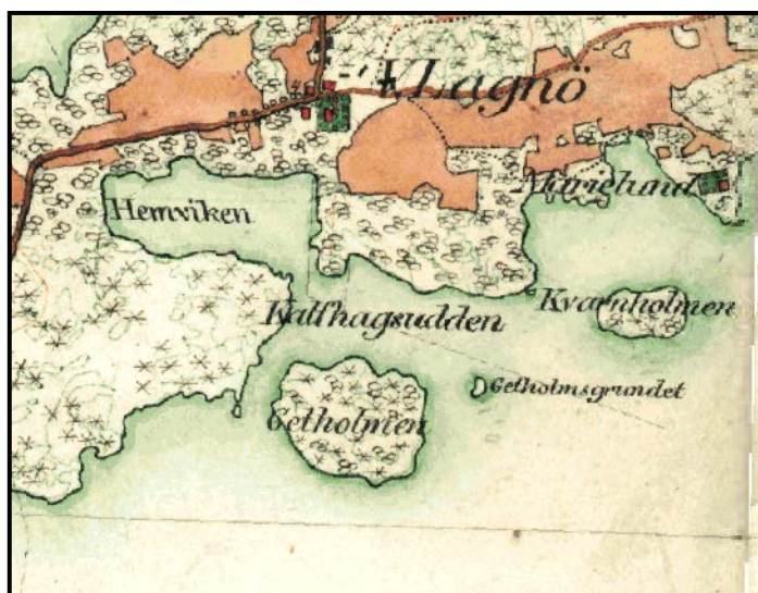
Utsnitt ur häradskartan från 1900-talets början.

Getholmen naturreservat var år 1809 belägen på ”Wester Lagnö och hästede säteriers ägor”. Häradskartan redovisar att Getholmen runt år 1900 var täckt av blandskog med både barr- och lövträd, medan Getholmsgrundet inte hade träd. Storskifteskartan från 1809, gårdsgårdsdelningskartan från 1859 och häradskartan från runt år 1900 visar dessutom att Getholmen var en ö och inte en halvö på den tiden.