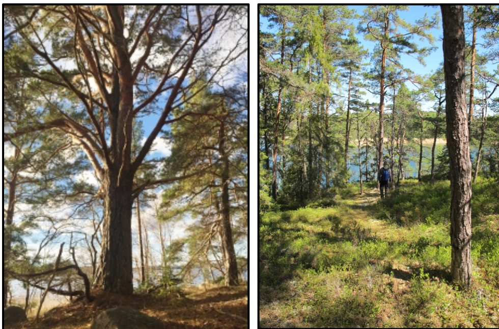
Exempel på blandbarrskog med lövinslag på Getholmen. Till vänster bild längs vattnet och till höger bild längs norra stranden.