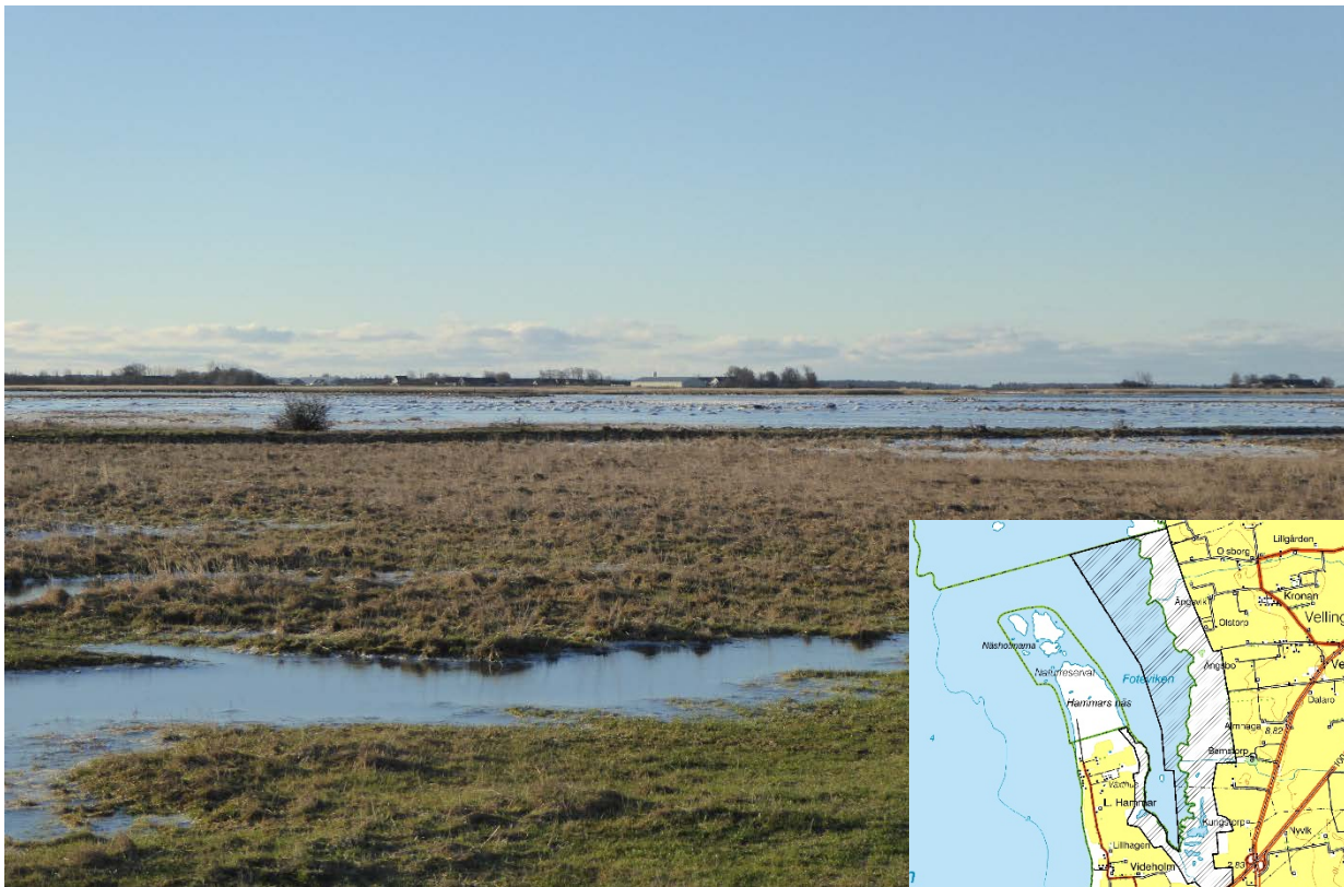
Vellinge ängar under översvämningen januari 2017.