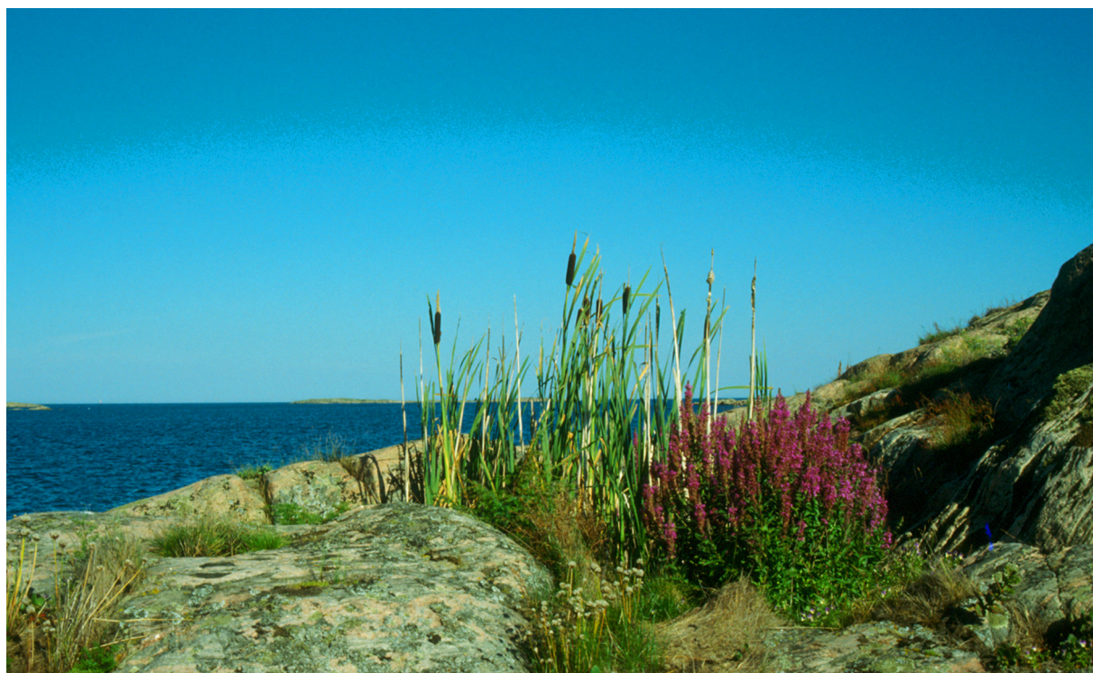
Fackelblomster ger skärgården färg på sensommaren.

Alla kostnader i samband med skötseln av reservatet bekostas med statliga medel. Även andra finansörer, exempelvis fonder eller stiftelser, kan bli aktuella. Dessa medel skall i så fall administreras av Länsstyrelsen. Eventuella intäkter från gagnvirke tillfaller staten.