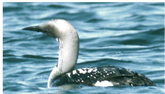
Storlom. Skärgårdsgäst i flyttider.

Länsstyrelsen Östergötland. Skärgårdsinventering 2002.