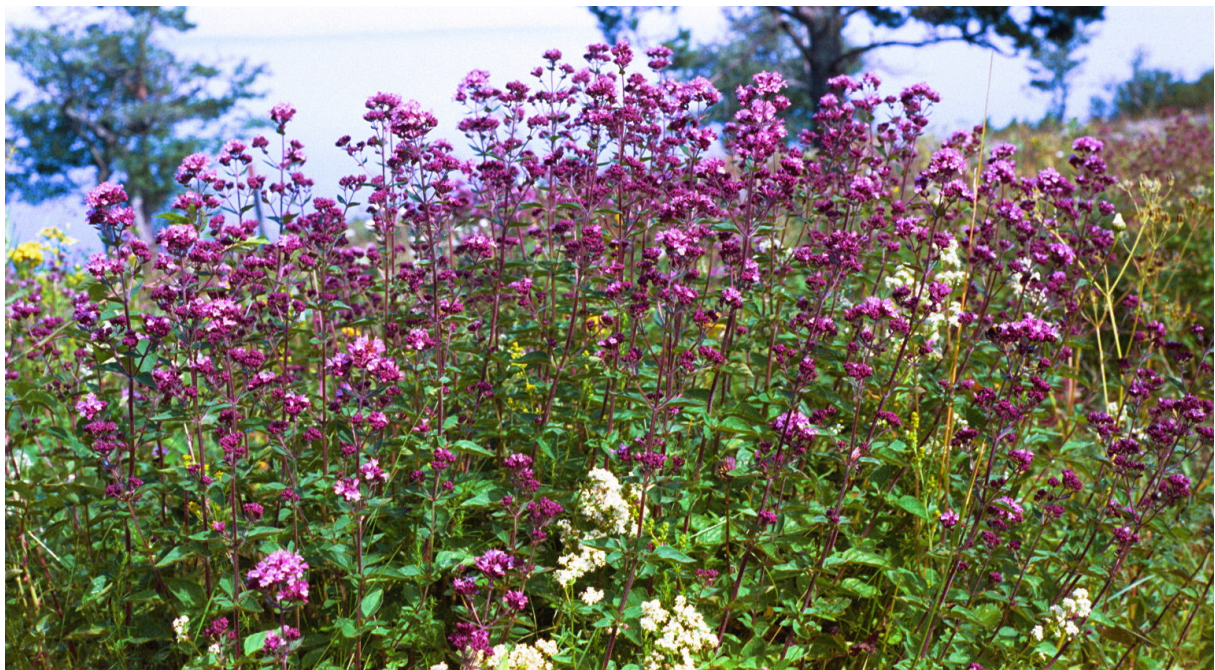
Kungsmytan gynnas i områden med urkalksten.