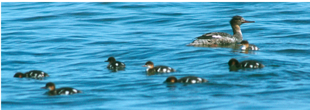
Småskrakehona med ungar.