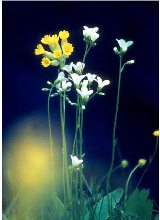
Gullviva och mandelblom.