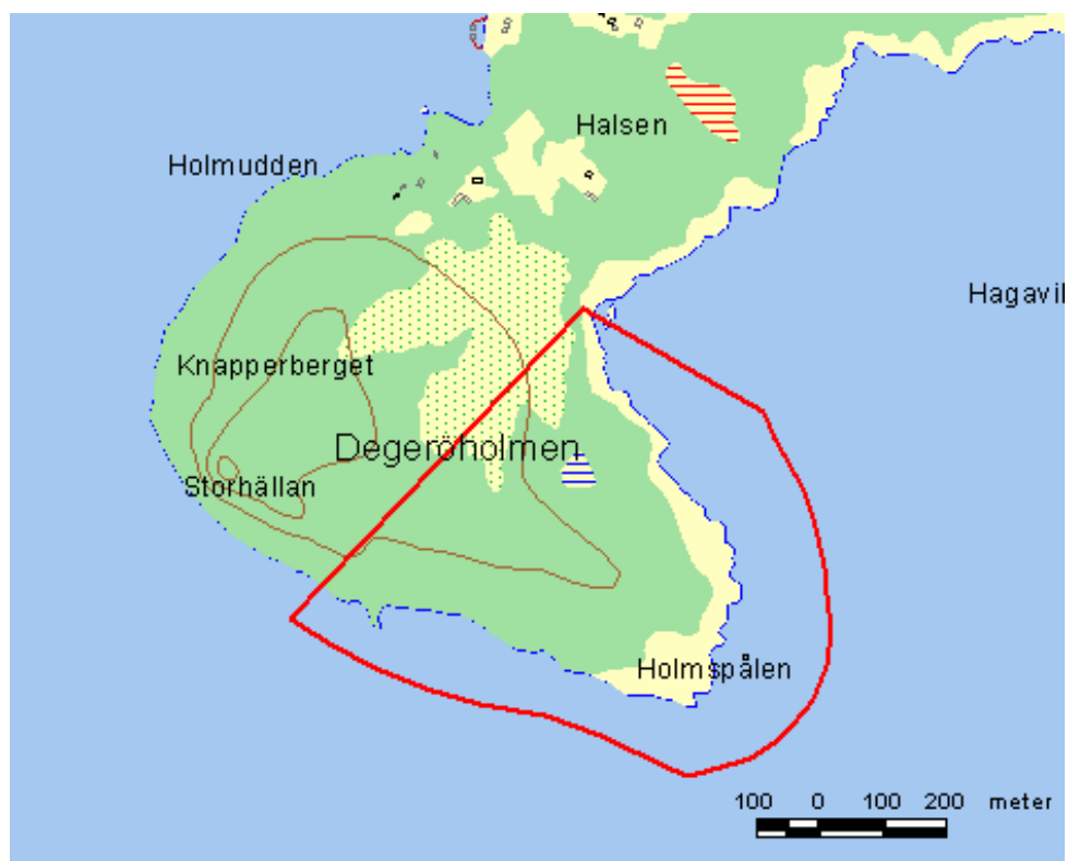
Karta över naturreservatet Degeröholmen. Reservatsgränsen är markerad med heldragen linje.